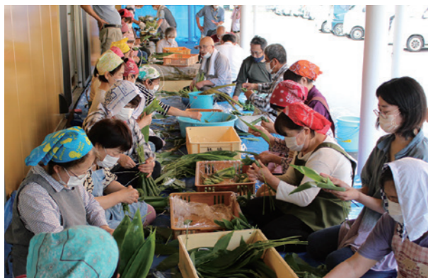
▲おひとりさま高齢者配布用笹巻づくり