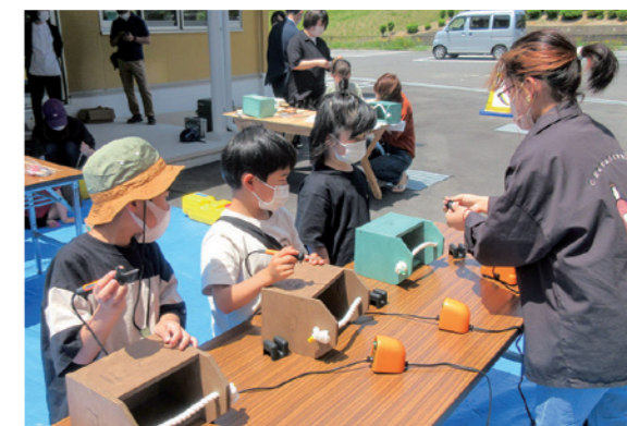
▲「新交流センターで木工体験をしよう!」