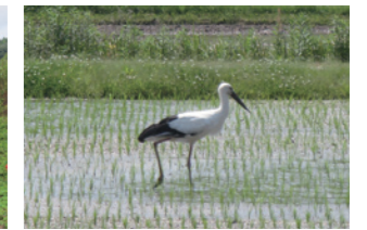
▲コウノトリの飛来