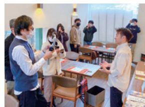
▲「カモンスちゃんねる」 取材