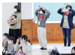
▲子育てサロン (スペチャレ高校生)