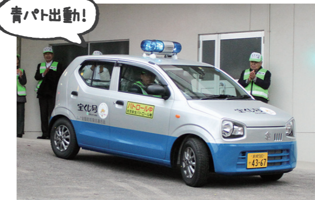
▲青色パトロール車「宝くじ号」出動式