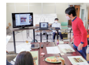
▲「おしゃべりカフェ」