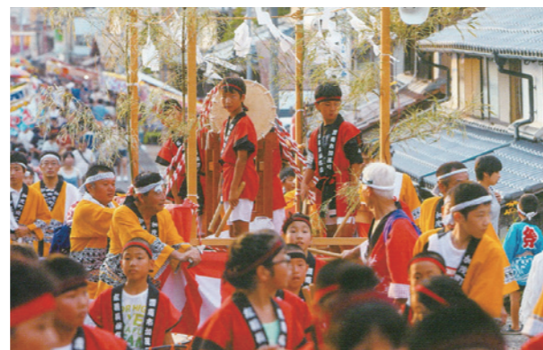
▲二十三夜祭左義長行列