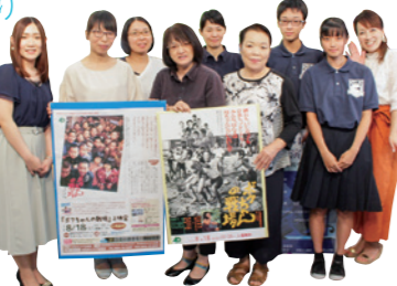
▲映画「ボクちゃんの戦場」 PR