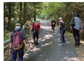
▲大人の光明寺遠足