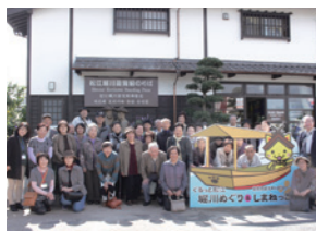
▲おひとりさま高齢者一日旅行