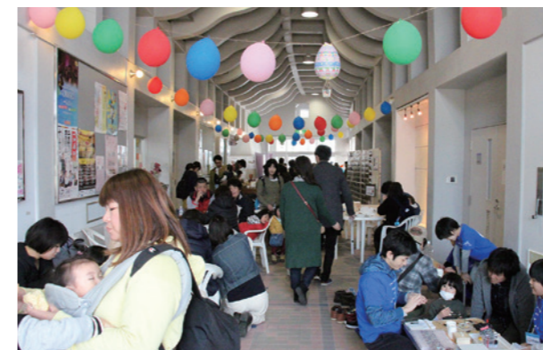
▲「ママじかん&お父さんと一緒」

様々な立場の住民が、能力を生かして地域づくりに参画できる仕組みをつくりまします。