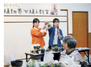
▲かもこ塾「寄せ植え教室」