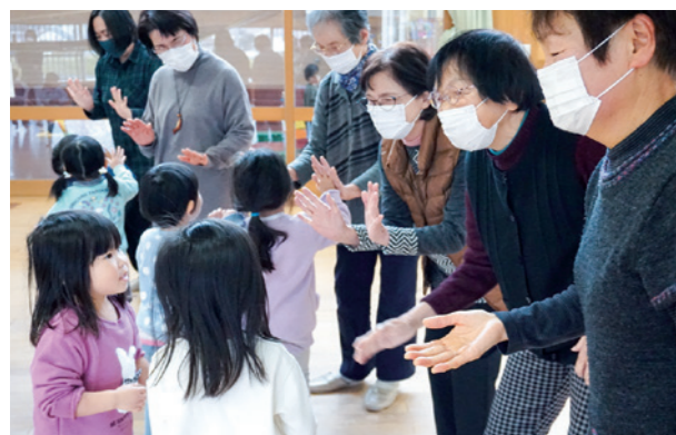
▲加茂こども園と高齢者サロン交流会