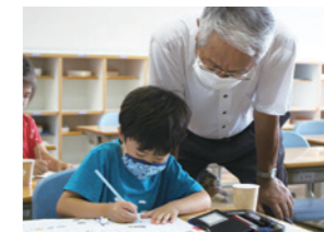
▲夏休み宿題応援団