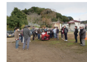
▲除雪ボランティア講習会