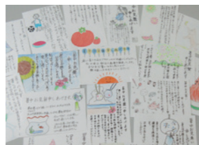
▲高齢者に宛てた加茂中学生からの暑中見舞い