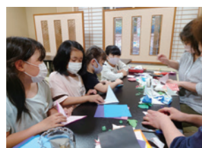
▲加茂おせっかい会議「折り紙教室」