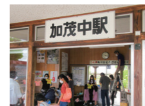
▲「加茂中駅を飾ろう」