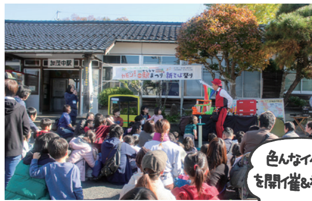
▲カモン!かもなか駅まつり