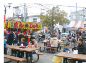
▲赤川だんだん広場春の市