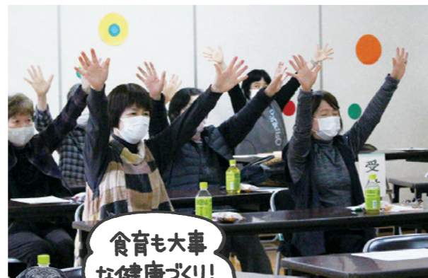
食育も大事な健康づくり!!