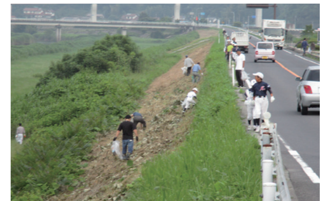
▲赤川クリーンキャンペーン