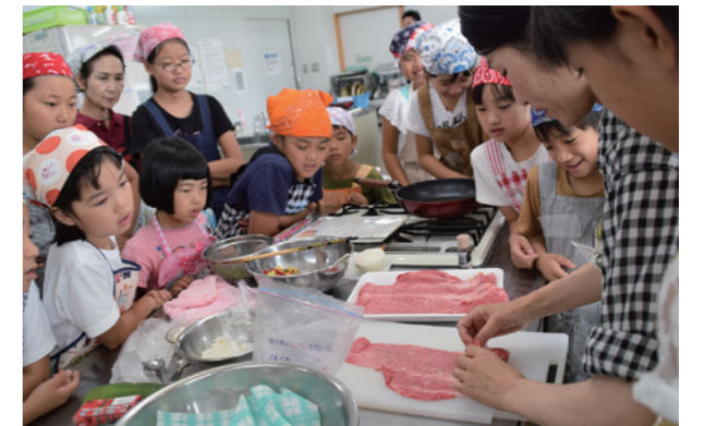
▲「かもこ塾キッズ」料理教室

「子育てのしやすいまち加茂」をめざし、子どもたちや保護者への支援を充実させます。